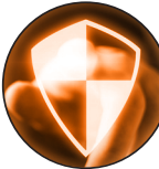
Sistema MACS > vedi pagg. 56-57