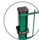
> s. 61-62-66