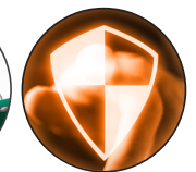
MACS Alarmsystem > s. 56-57